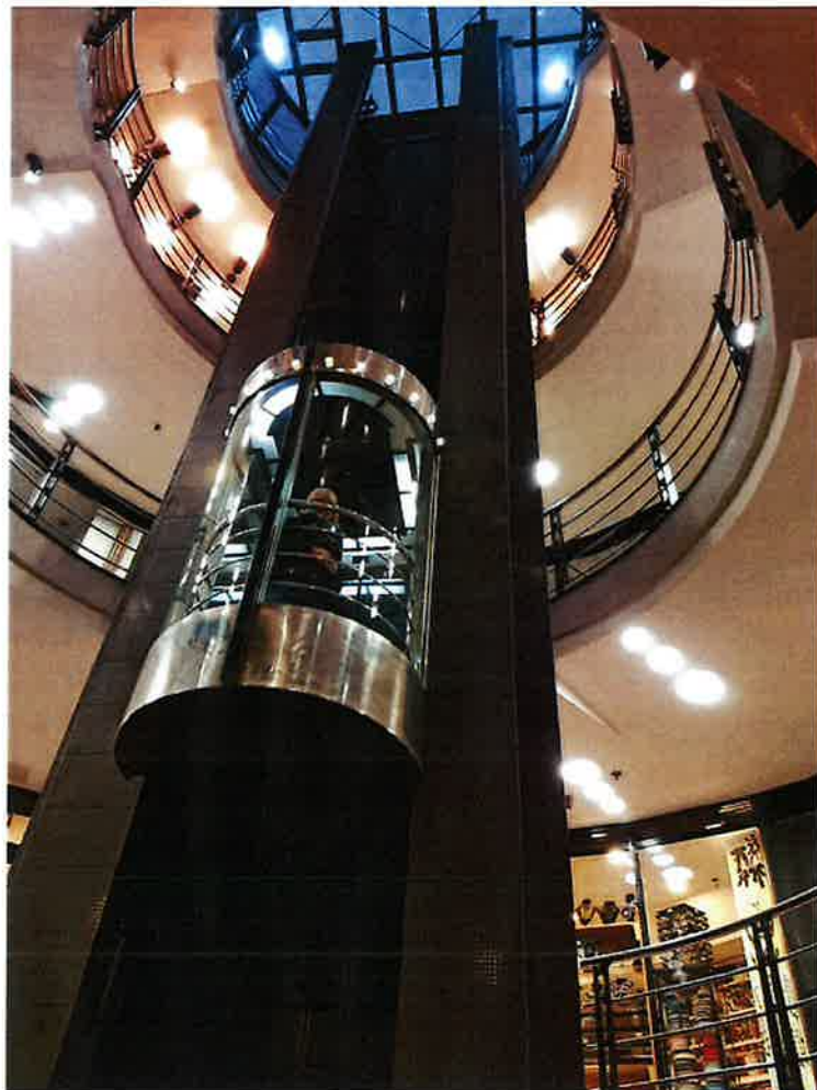
Interijer i panoramsko dizalo